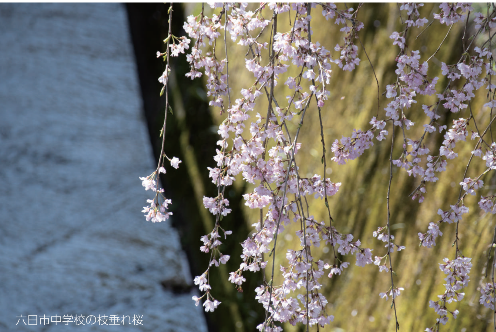
六日市中学校の枝垂れ桜