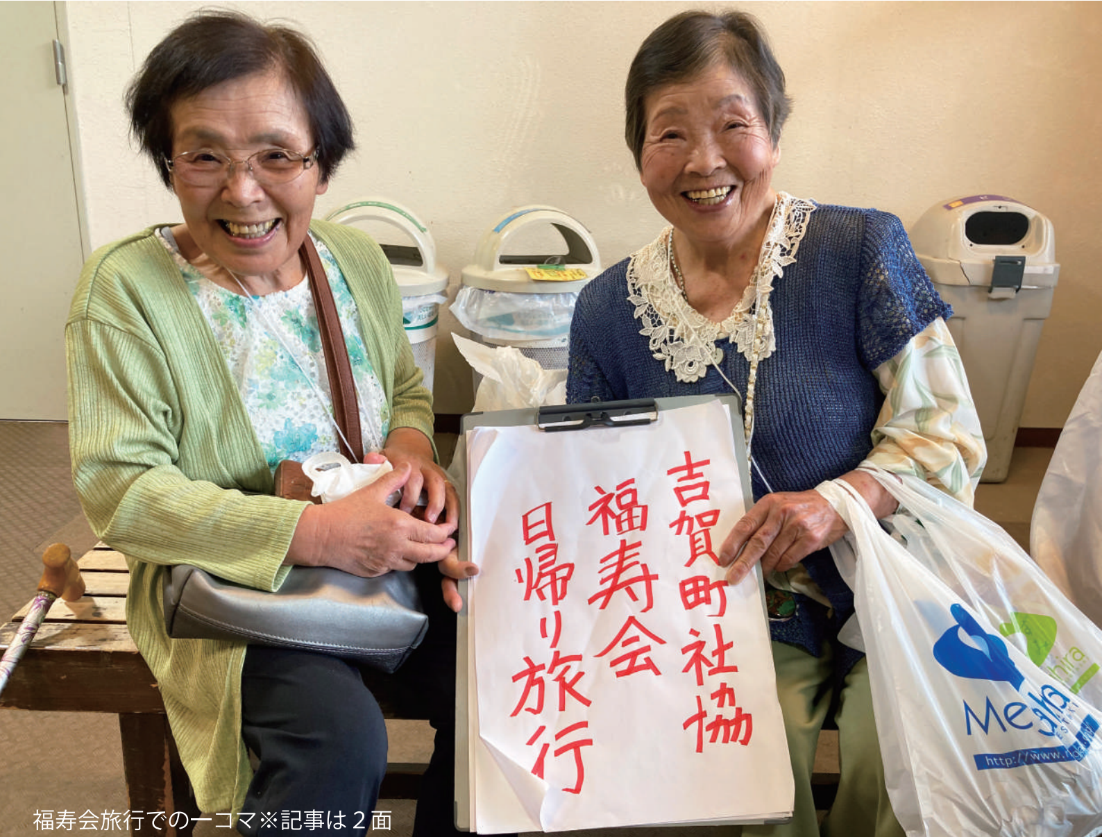
福寿会旅行での一コマ※記事は2面