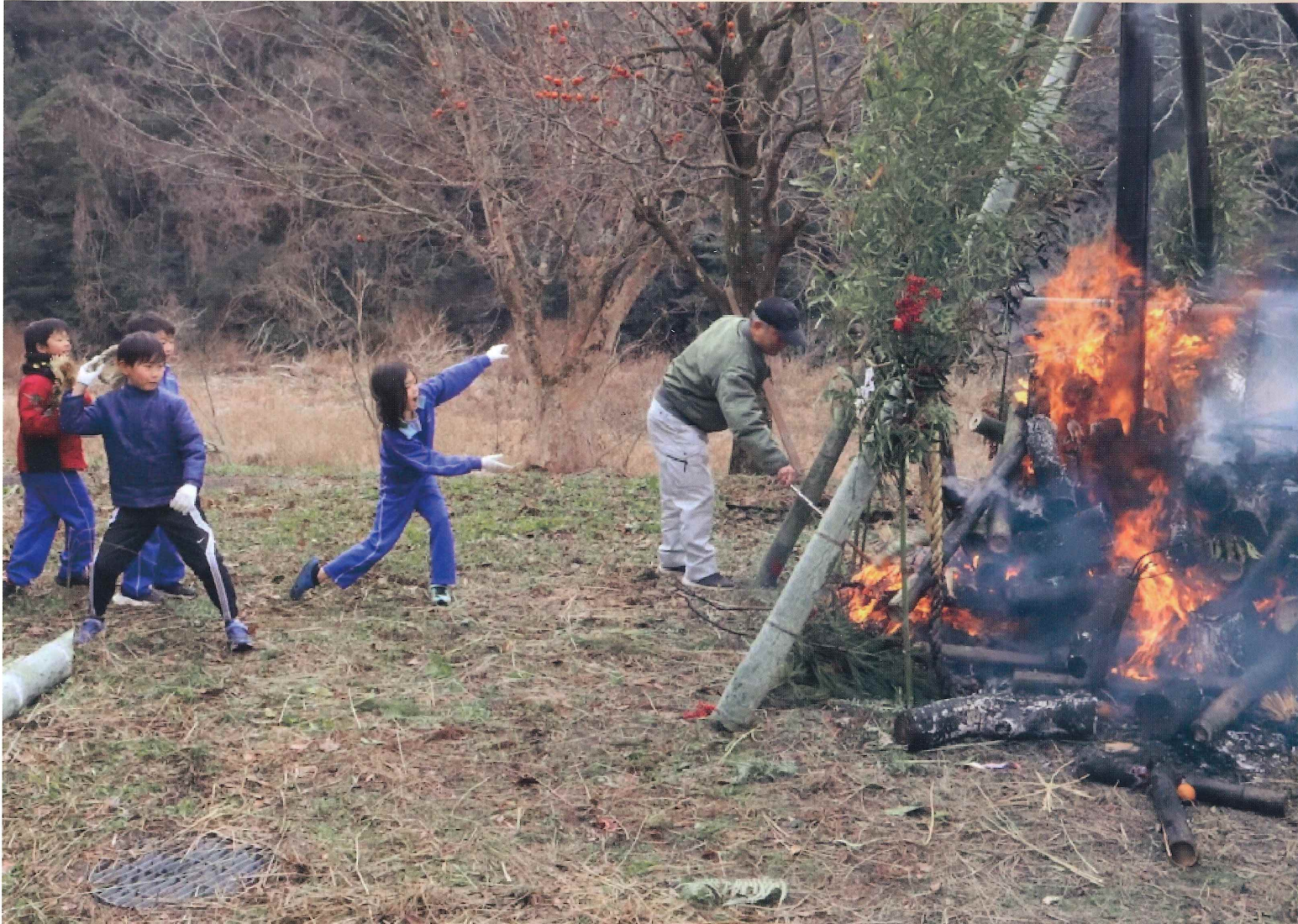
▲柿木地区のとんど焼き