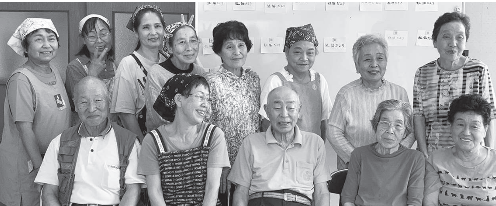
【題字コンテストに参加いただいた白谷サロンの皆様（令和3年8月10日撮影）】