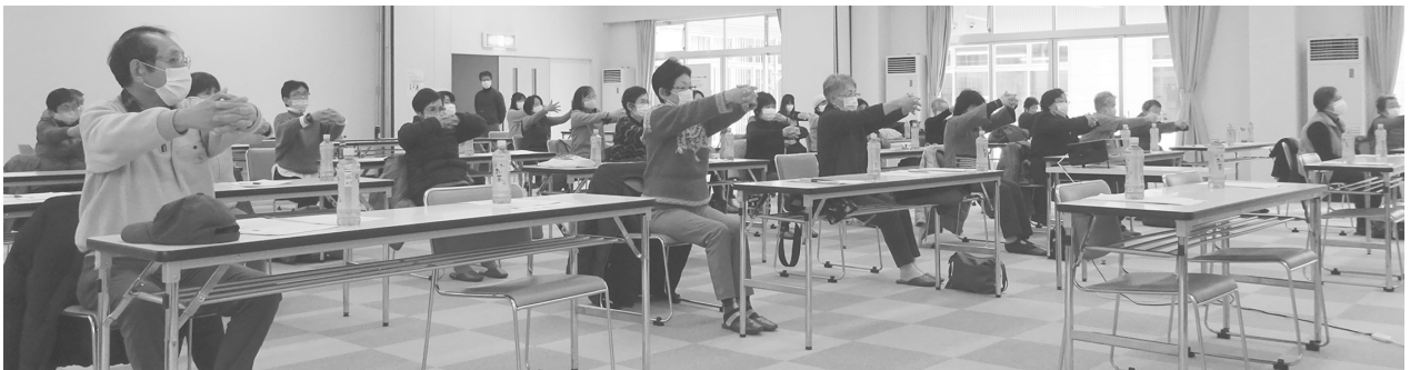
↑ 題字コンテストに参加頂いた、サロンボランティア研修の皆さん