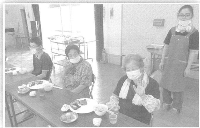
《↑ たまには、みんなで食事会》