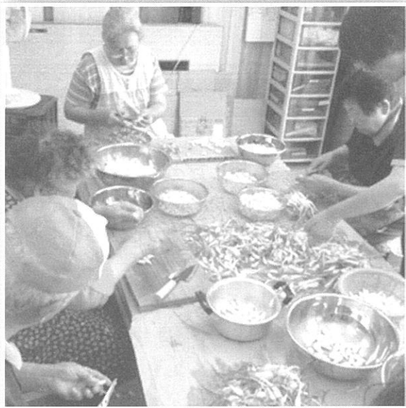
《↑ 吉賀町特産「らっきょう」の皮むき》

アスノワ事業所では、一般企業への就労が難しい方、離職された方、仕事をすることで社会的自立を目指したい方へ、働く場を提供するとともに、知識および能力の向上のために必要な訓練、作業を行っています。