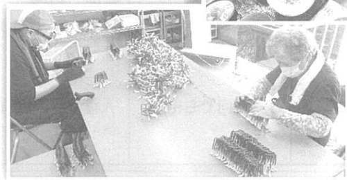
《↑ 建築資材の梱包中》