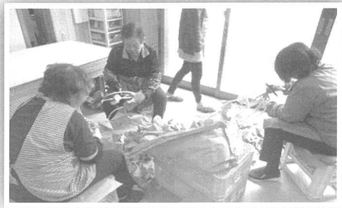
《↑ みんなで野菜の調製中》