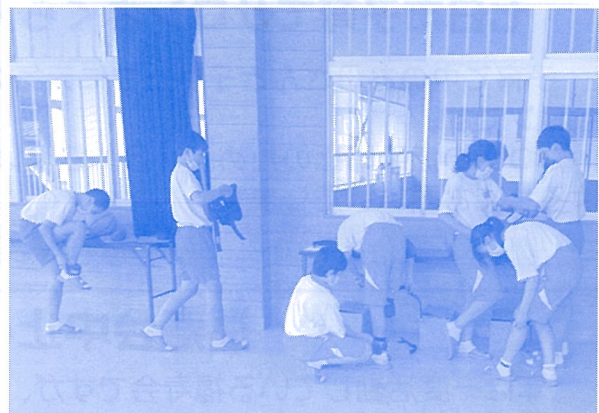
手足に重りを付けて疑似体験中