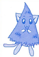
コーニャン(高野燐)