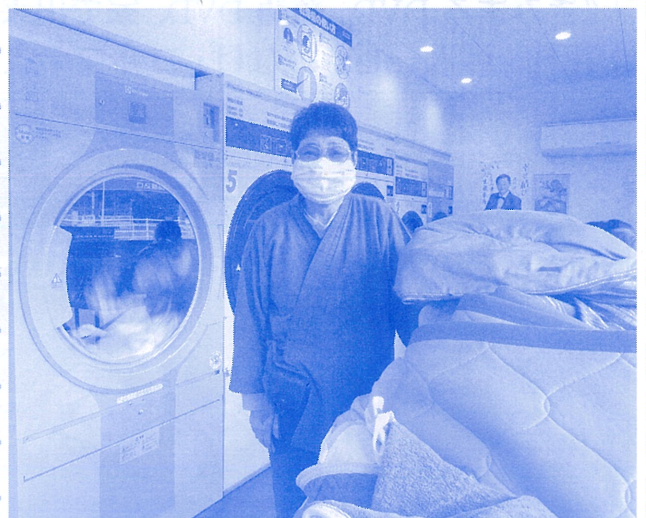
スーパーランドリー六日市店にて