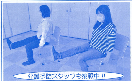
介護予防スタッフも挑戦中!!

このカレンダーの良い所は、場所は違えど、みなさんも同じ挑戦をしている、と実感できること「ちょっと面倒だな・・・」と思う日も、他にも同じことを頑張っている人が居る!と思えば、力が湧いてくるような気がしませんか?とはいえ、無理は禁物です。体の痛みなどがあれば無理をしないで、できる範囲で一緒に挑戦してみませんか?