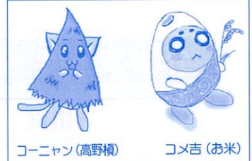
コーニャン(高野横)