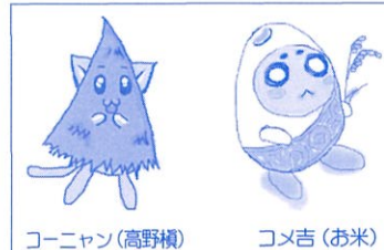
コーニャン (高野横)