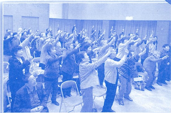
↑じゃんけん大会! 皆さん真剣です。!!