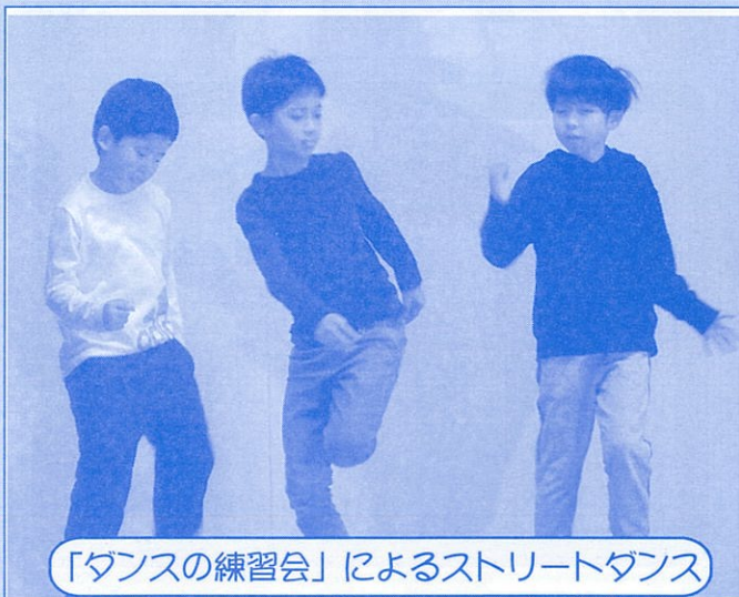
「ダンスの練習会」によるストリートダンス