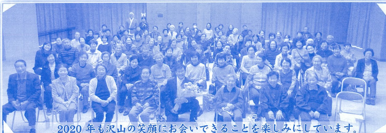
2020年も沢山の笑顔にお会いできることを楽しみにしています。

各種ご案内で教室の開始時間が異なっており、混乱を招きましたこととお詫び申し上げます。