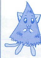
コーニャン (高野槲)