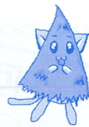
コーニャン(高野槇)