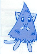
コーニャン (高野横)