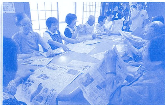
新聞紙を途中で切れないように細くちぎっていきます。誰が一番長いでしょうか・・・？