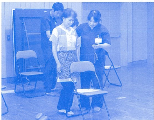
体力測定・片足立ちをしています

吉賀町では、さまざまな介護予防の取り組みをしていますが、今回は六日市病院のリハビリの先生方による、サロン訪問についてご紹介したいと思います。