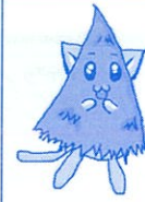
コーニャン(高野横)