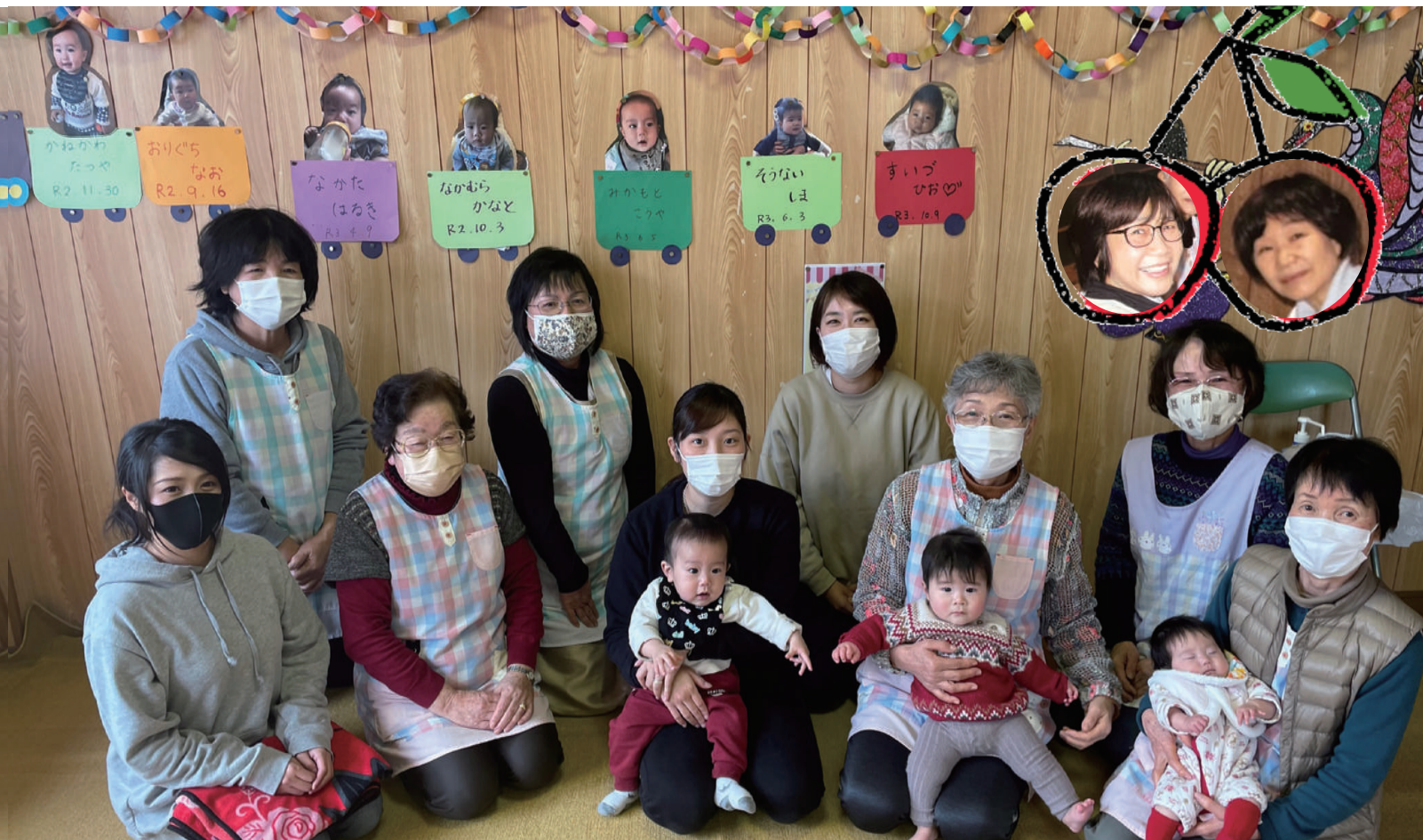
題字コンテストに参加して頂いた、子育てサロン「さくらんぼクラブ」の皆様(令和4年1月23日撮影)