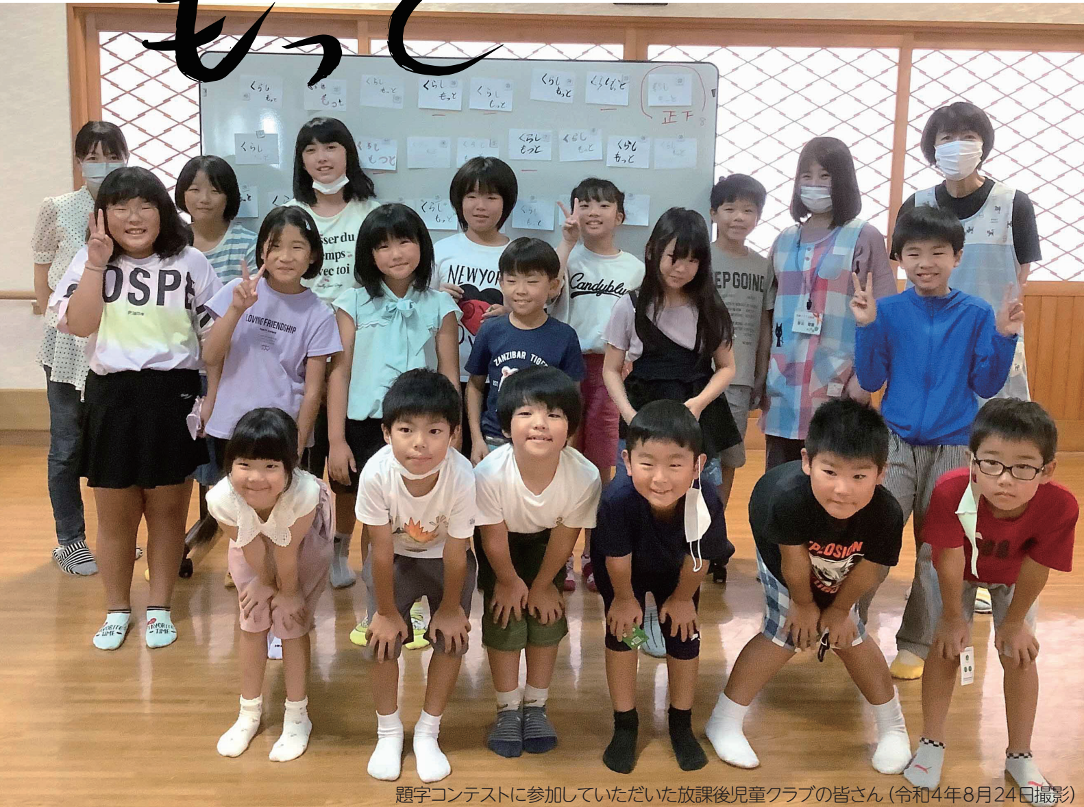
題字コンテストに参加していただいた放課後児童クラブの皆さん(令和4年8月24日撮影)