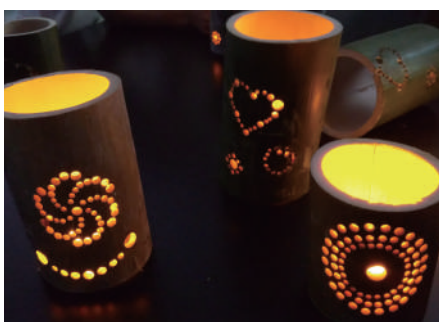
↑完成した竹灯籠 ↓工具を使って作ります

この7月には、蔵木ふるさとまつりで飾るため に、小学校で竹灯籠を作りました。夏休みには、 川遊びや歴史探索、子どもの夏祭りなどを行って いきます。「地域みんなで子どもを育てる」そして 「大人も一緒に、みんなで楽しく豊かな地域を育て ていく」この活動を温かく見守っていただき、お 近くの方など、ぜひ参加されてみませんか。