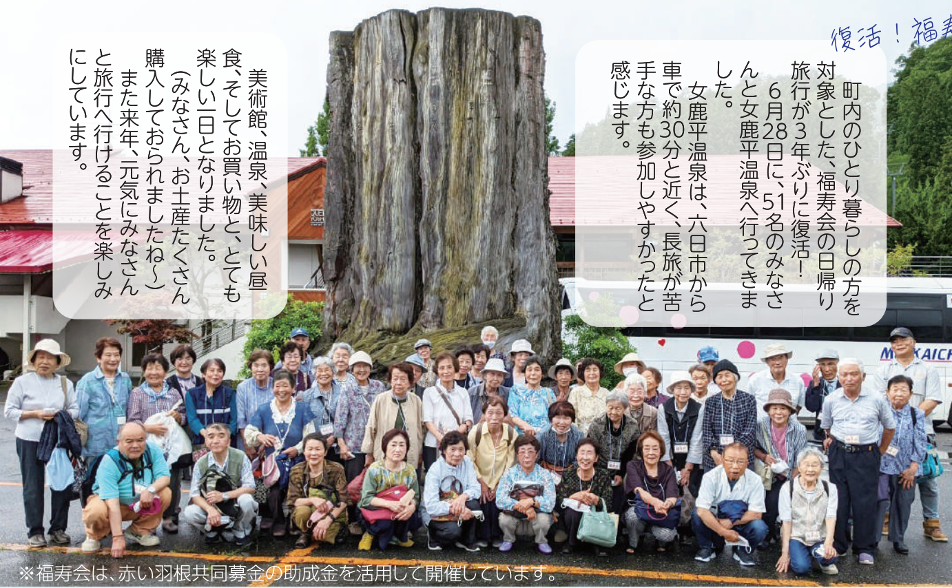
※福寿会は、赤い羽根共同募金の助成金を活用して開催しています。

美術館、温泉、美味しい昼食、そしてお買い物と、とても楽しい一日となりました。(みなさん、お土産たくさん購入しておられましたね!) また来年、元気にみなさんと旅行へ行けることを楽しみにしています。