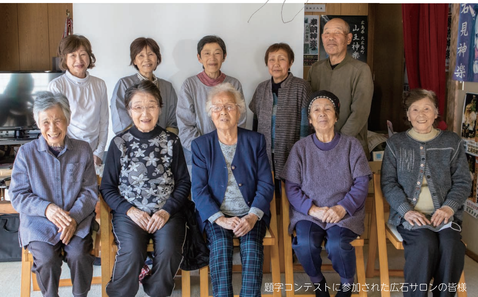
題字コンテストに参加された広石サロンの皆様